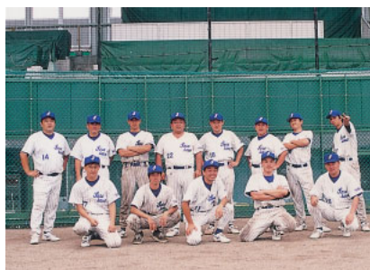
野 球 部