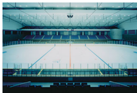
アイスアリーナ / 他社との共同施工