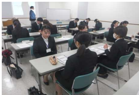
事前研修 目標設定