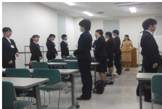
事前研修 ビジネスマナー